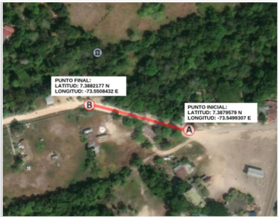
Ilustración. Localización Específica 3

INTERVENTORÍA INTEGRAL PARA EL PROYECTO: "CONSTRUCCIÓN DE PLACA HUELLAS EN EL SECTOR RURAL DEL MUNICIPIO DE SABANA DE TORRES VEREDA EL K 80 Y EL CENTRO POBLADO LA GÓMEZ SABANA DE TORRES BPIN 20240214000243"