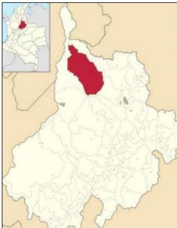
Ilustración. Localización General Sabana de Torres.

El proyecto de inversión denominado “ CONSTRUCCIÓN DE PLACA HUELLAS EN EL SECTOR RURAL DEL MUNICIPIO DE SABANA DE TORRES VEREDA EL K 80 Y EL CENTRO POBLADO LA GÓMEZ SABANA DE TORRES ” se ubica en el municipio de Sabana de Torres, Departamento de Santander. En la siguiente figura se puede encontrar la localización de Sabana de Torres dentro de la geografía nacional.