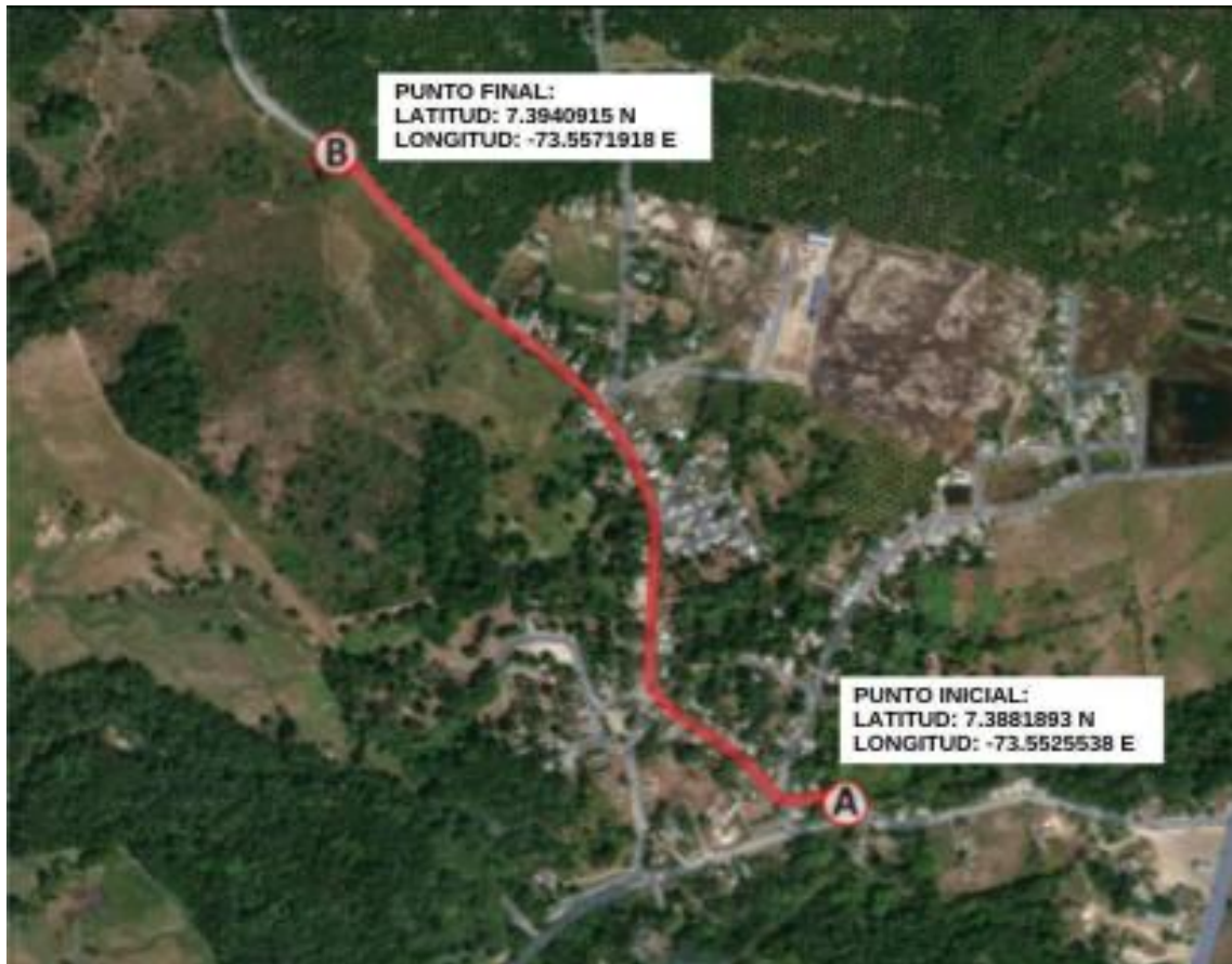
Ilustración. Localización Específica 4

INTERVENTORÍA INTEGRAL PARA EL PROYECTO: "CONSTRUCCIÓN DE PLACA HUELLAS EN EL SECTOR RURAL DEL MUNICIPIO DE SABANA DE TORRES VEREDA EL K 80 Y EL CENTRO POBLADO LA GÓMEZ SABANA DE TORRES BPIN 20240214000243"