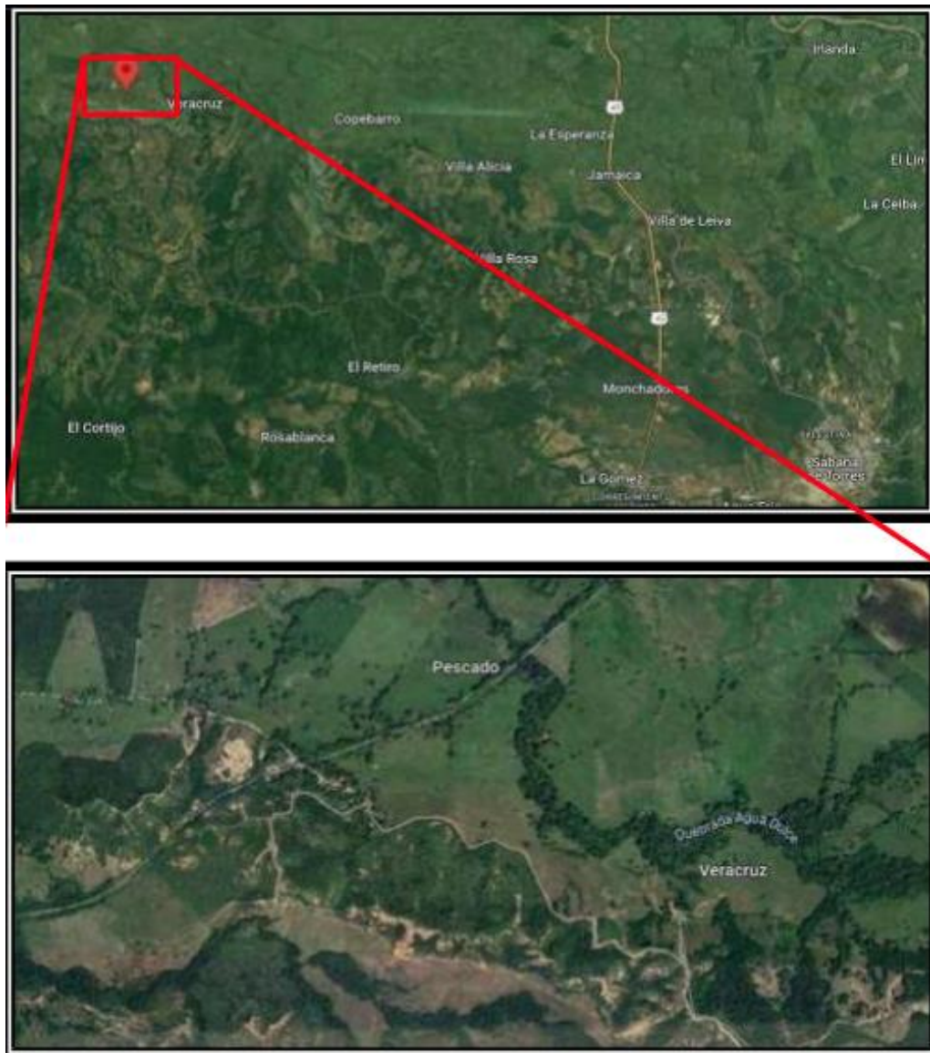
Ilustración. Localización Específica Tramos.

El proyecto se llevará a cabo en la vereda el Km 80. En la siguiente figura se puede apreciar la localización particular de la zona de estudio.