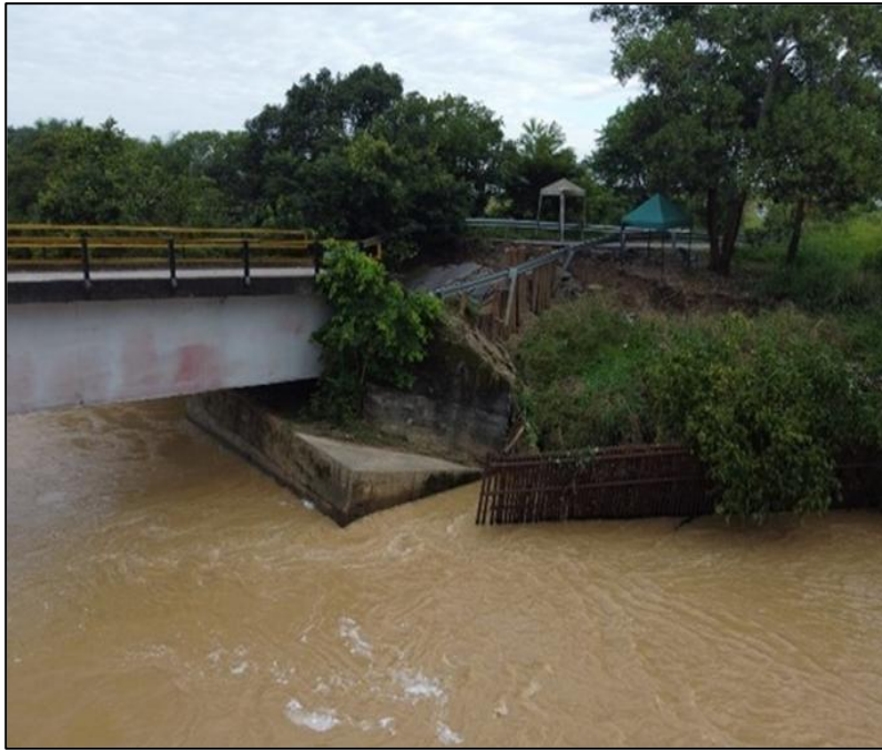
Ilustración. Perspectiva general del sitio de intervención.