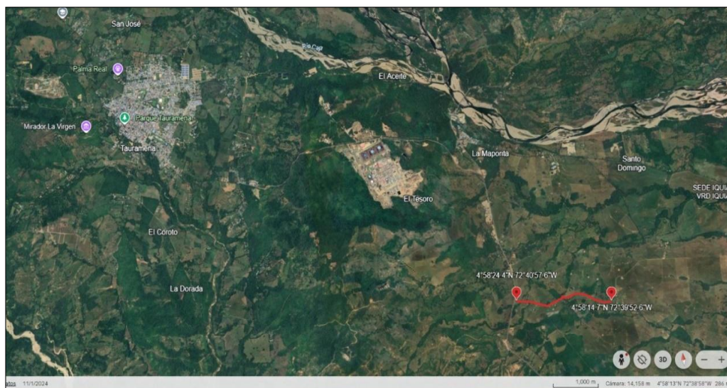
Figura 2. Localización específica del proyecto